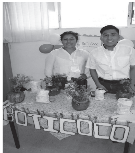
Imagen 2. Proyectos de emprendimiento