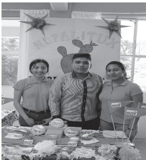
Imagen 1. Evento de emprendedores.