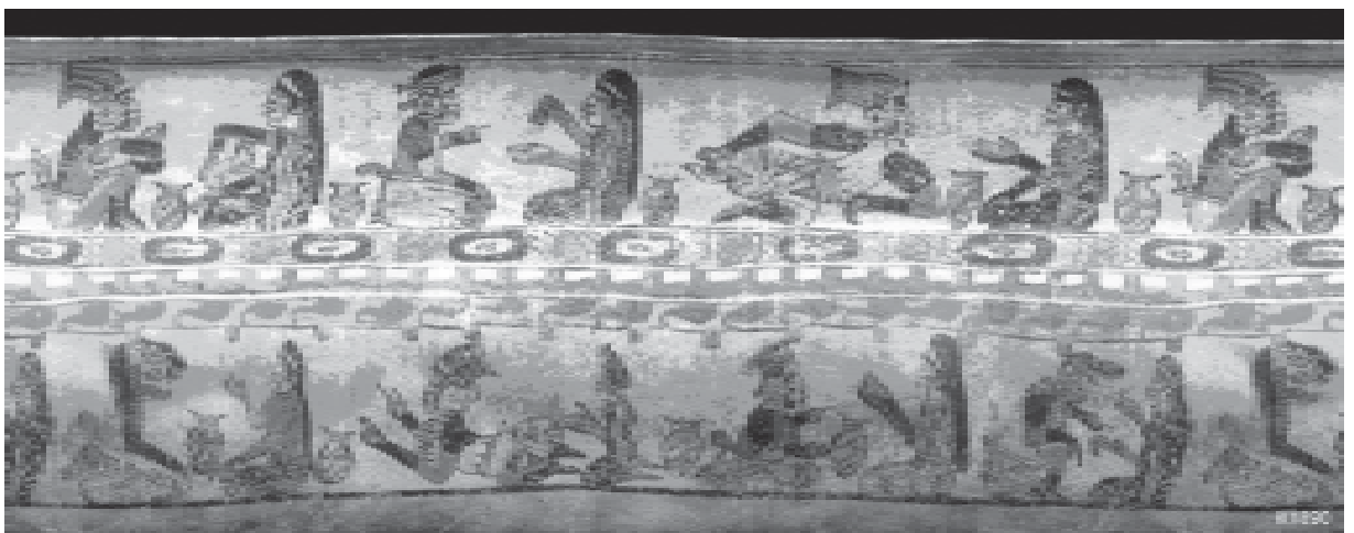
Figura 3. Vasija del clásico tardío maya en la que aparecen unos individuos departiendo mientras utilizan enemas. Se ven recipientes con formas semejantes a la propia vasija, cuyas bocas tienen picos donde se ve la espuma de las bebidas alcohólicas fermentadas.

Aunque en el pasado (Sánchez-Marroquín, 1967) se han evaluado los microorganismos del pulque, estos estudios utilizan métodos tradicionales para la cuenta, lo cual impide registrar una gran cantidad de microorganismos importantes. Recientemente, Escalante y col., 2004, analizaron tres muestras diferentes de pulque don-