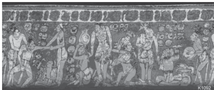
Figura 1. Escena del uso de los enemas en la que aparece el glifo Chi (recuadro), que significa pulque y otras bebidas alcohólicas.

El enema más antiguo conocido en Mesoamérica procede de Xochipala, Guerrero (fig. 2). Data de 1200 a 900 a.C., aproximadamente. El uso de enemas contra enfermedades y dolencias del tracto digestivo en las culturas prehispánicas se registra por evidencias arqueológicas y por recopilaciones coloniales (Códice florentino). Su uso se asocia también a ritos o ceremonias donde se busca el éxtasis mediante la embriaguez (Furst, 1994). Ver figuras 1 y 5.