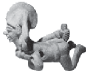
Figura 5. Figura antropomórfica de terracota del clásico tardío que se suministra un enema "psicoactivo", longitud 12.7 cm, Veracruz. Tomado de Johnson, 1992.

Se apuntaron distintos padecimientos del tracto digestivo inferior a lo largo del texto, evidencias experimentales relacionan la ausencia de diversos microorganismos con estos padecimientos. El pulque contiene un consorcio microbiano similar al que contiene el tracto digestivo y esto solamente se dio a conocer recientemente por Escalante y col. 2004. Resulta interesante plantear la posibilidad de que las culturas prehispánicas