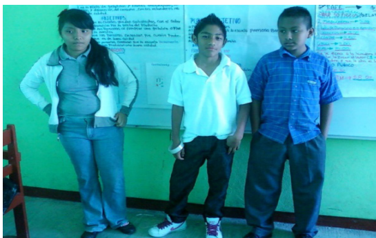
Figura 1. Niños de educación primaria en el taller de emprendimiento infantil. Escuela Primaria Rural. Tuxtepec, Oaxaca. 26 de Octubre de 2013.

En México se habla de impulsar la EE y la EF desde la educación básica pero son muy escasos los esfuerzos que se han hecho para evaluar la situación que prevalece sobre este tema en dicho nivel educativo (fotografía 1).