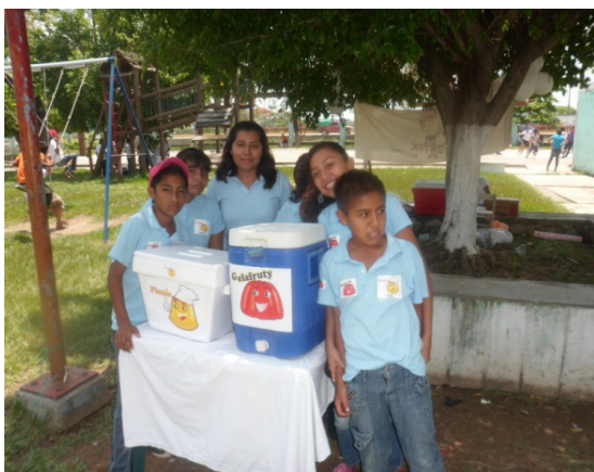
Fotografía 3. Actividad de ventas como resultado del taller de emprendimiento infantil. Escuela Primaria Rural. Tuxtepec, Oaxaca. 11 de enero de 2014.

En la educación primaria la EE y la EF fomenta en los niños cualidades como la creatividad, iniciativa e independencia (fotografía 3), mismas que contribuirán