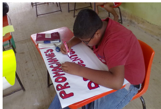
Fotografía 2. Elaboración de carteles en el taller de emprendimiento infantil. Escuela Primaria Rural. Tuxtepec, Oaxaca. 26 de Octubre de 2013.

por la Fundación Educación Superior Empresa (FESE), en coordinación con la Asociación Nacional de Universidades e Instituciones de Educación Superior (ANUIES) a través del subprograma “Mi primera empresa: emprender jugando” (De la Cruz, 2014). Los objetivos de dicho subprograma son desarrollar en niños que cursan el quinto y sexto grado de educación primaria, conocimientos teóricos básicos y el desarrollo del potencial emprendedor, la comprensión del entorno social, la planeación de una empresa en un proceso lúdico y, la gestión